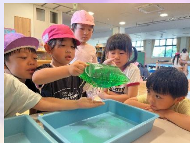
みんなで沢山の爪楊枝を刺したけど…セーフ！！