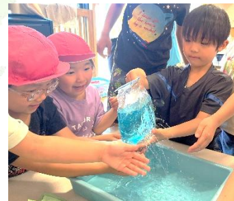
爪楊枝を抜くと…噴水みたい！！