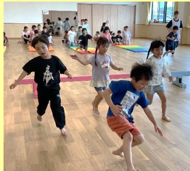
走って1つ目の平均台をジャンプ！ 2つ目の平均台は下をくぐったよ！