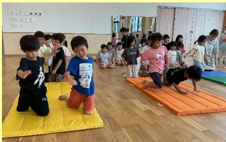
膝で上手に歩けるかな？ 転びそうになっても、手をつけば大丈夫！