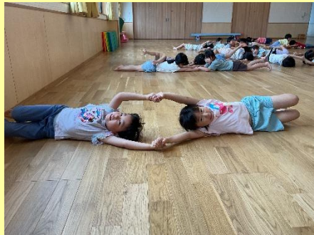
手を繋いでゴロンゴロン！ まっすぐ転がるのが難しかったよ