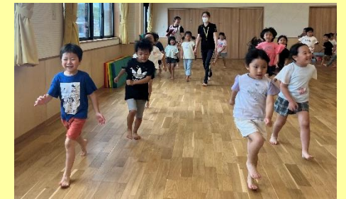
みんなでスキップ♪