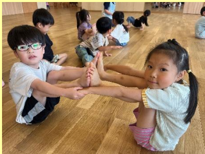
みんなで準備体操！ こんなこともできちゃうよ～！

昨日から運動教室を楽しみにしていた子ども達。講師の先生が来てくださり年長組として話を聞く時のかっこいい座り方(正座と三角座り)の練習から始まり、お腹、背中を使って体幹を鍛える遊びをたくさん教わりました。中には子ども達が苦手だな…と思うような少し難しい動きもありましたが、友だちや保育者と一緒に「やってみよう！」とチャレンジする姿がたくさん見られましたよ。