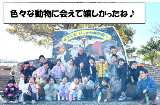
色々な動物に会えて嬉しかったね♪