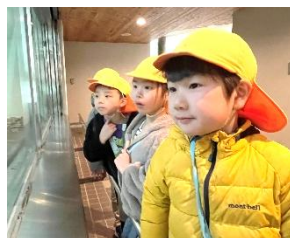
ライオンもレッサーパンダ もお昼寝中...